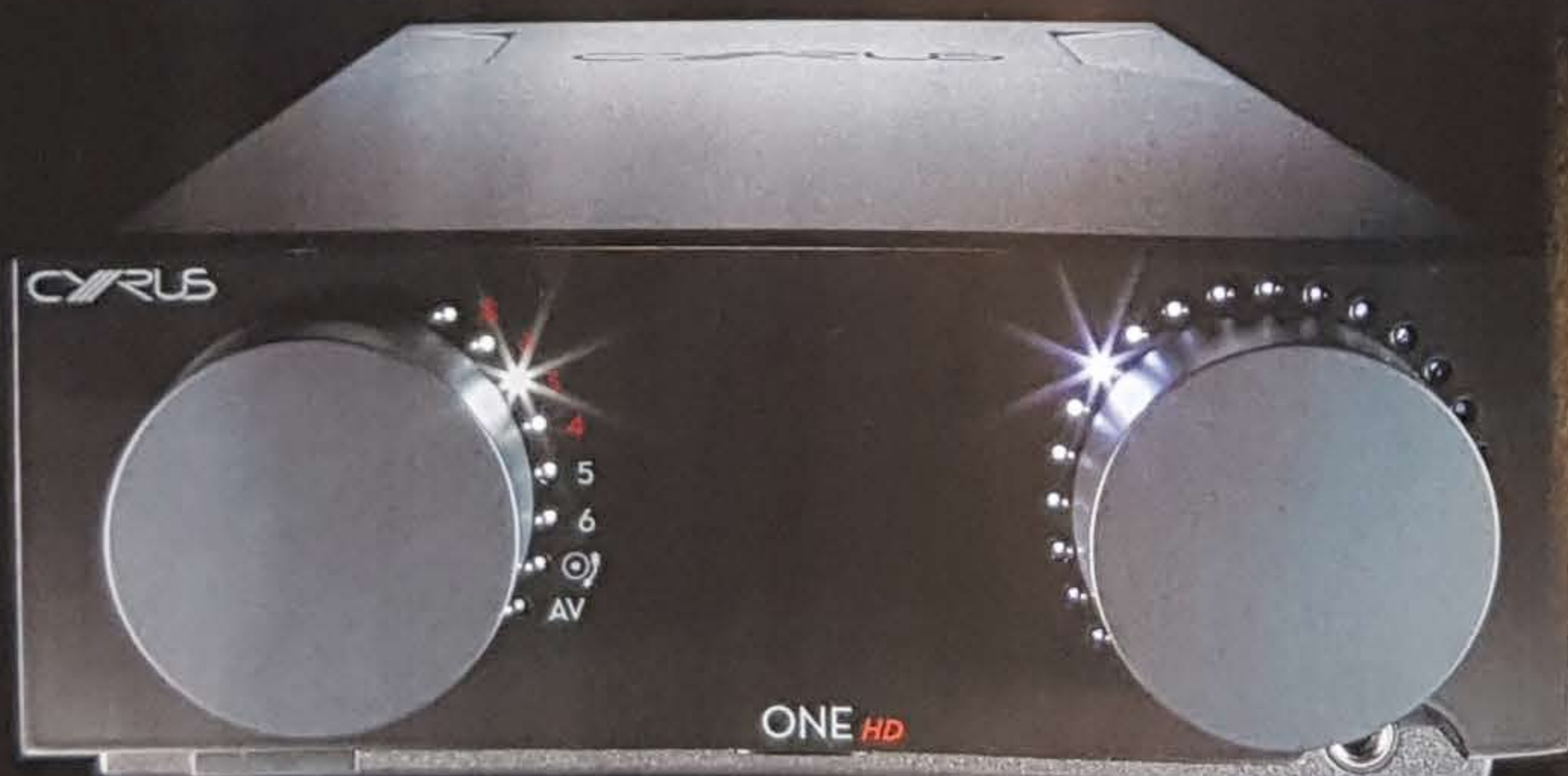
▲ Das nahezu symmetrische, extrem aufgeräumte Design des Cyrus ONE ist aus unserer Sicht ein veritabler Hingucker.

Okay, das kennen Fans der Marke Cyrus zwar schon, aber eher von den legendären Class-AB-Vertretern, die dem